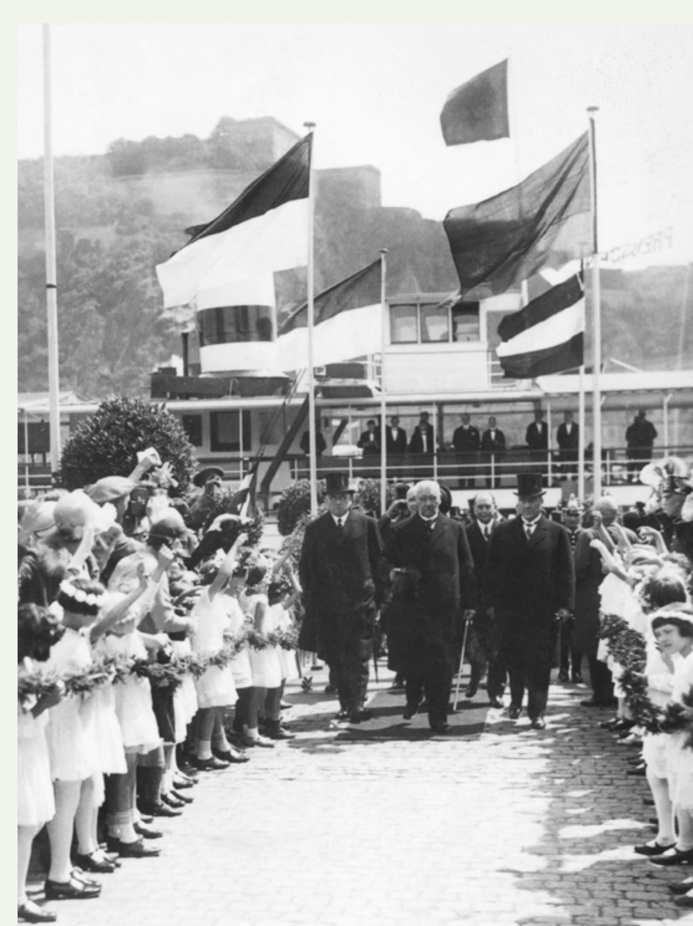
Hindenburg bei der zentralen Befreiungsfeier in Koblenz am Deutschen Eck am 22. Juli 1930

Ursachen waren die durch die Weltwirtschaftskrise ausgelöste hohe Arbeitslosigkeit und die weit verbreitete Verbitterung über die als Schmach empfundenen Bedingungen des Versailler Vertrags, die nationalistische Strömungen stärkte.