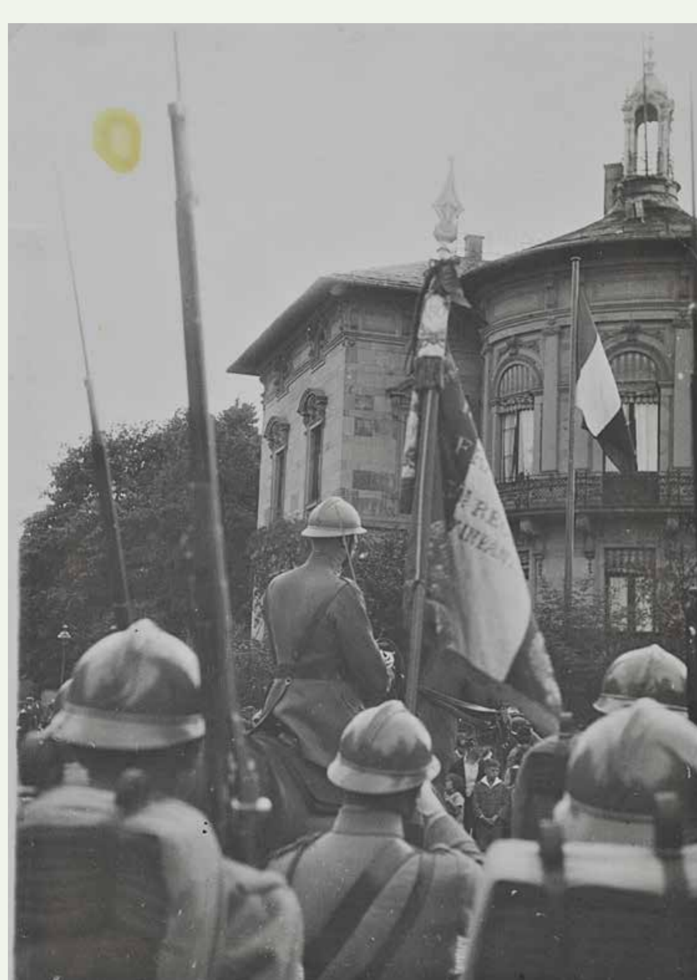
Einholen der Trikolore in Landau