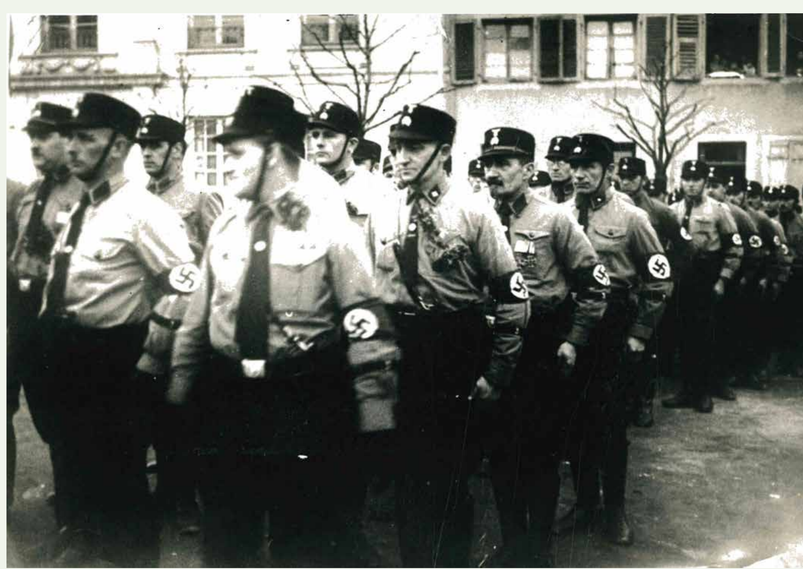
SA-Aufmarsch auf dem Rathausplatz in Landau, um 1930-1932

Enthüllung des Befreiungsdenkmals auf dem Schillerplatz in Mainz am 20.7.1930 mit Reichspräsident Hindenburg im offenen Wagen